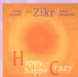
HAPPY HAPPY CRAZY (2005)