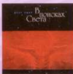
В ПОИСКАХ СВЕТА ВАННЕ ИРИ АСОНИЧЕСКОГО ПАРИЖА IN SEARCH OF LIGHT BATHY (VANES) OF OSOANIRI (2001)