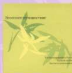
ВЕСЕННЕЕ ПУТЕШЕСТВИЕ SPRING TRAWEL (2005)

"То, что мы поем – это наш синтез ритуальных традиций: тибетских, буддийских, суфийских, православного радения, народного причитания, шаманского действа. И еще классическая музыка, и неклассическая"