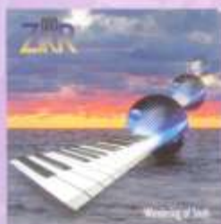
СВОБОДНЫЙ ПОЛЕТ FREE FLIGHT (2000)