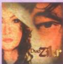
ДУЭТ "ЗИКР" / DUO ZIKR Юбилейный диск (1998)