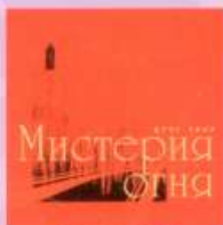
МИСТЕРИЯ ОГНЯ FIRE MYSTERY (2003)