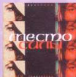
МЕСТО СИЛЫ PLACE OF POWER (2003)